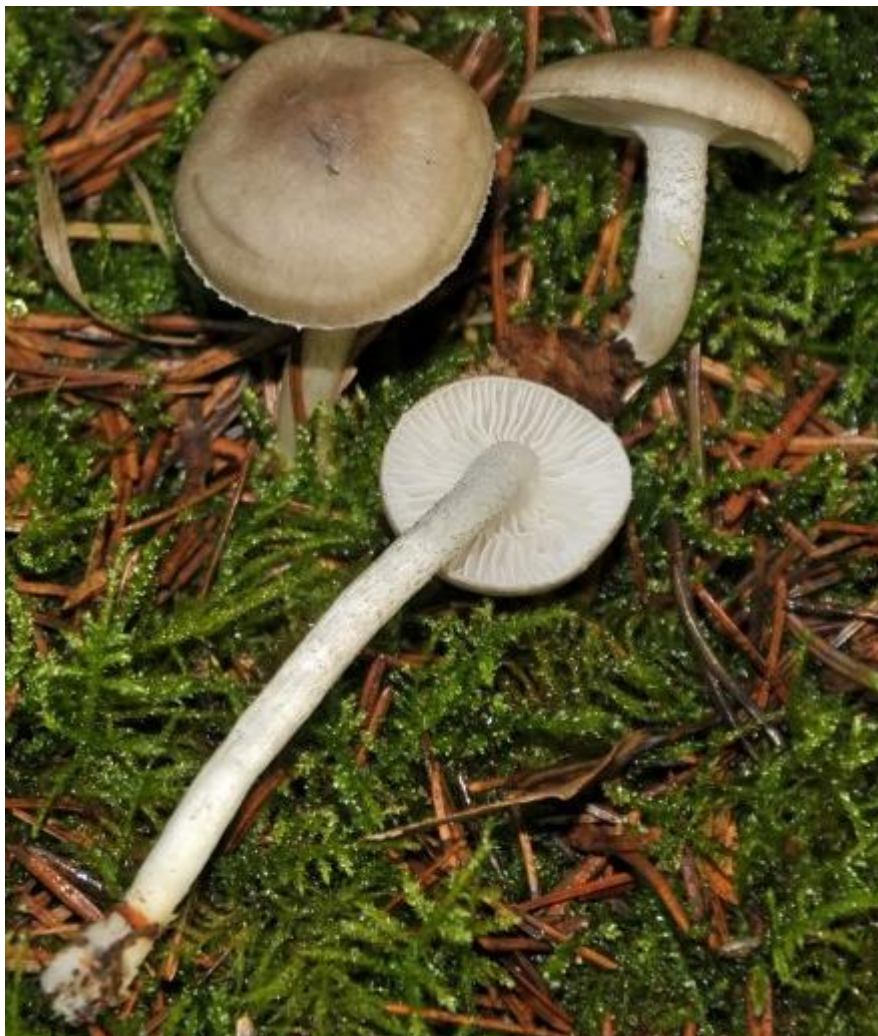
Ook geen alledaagse jongen deze stippeelsteelslijmkop