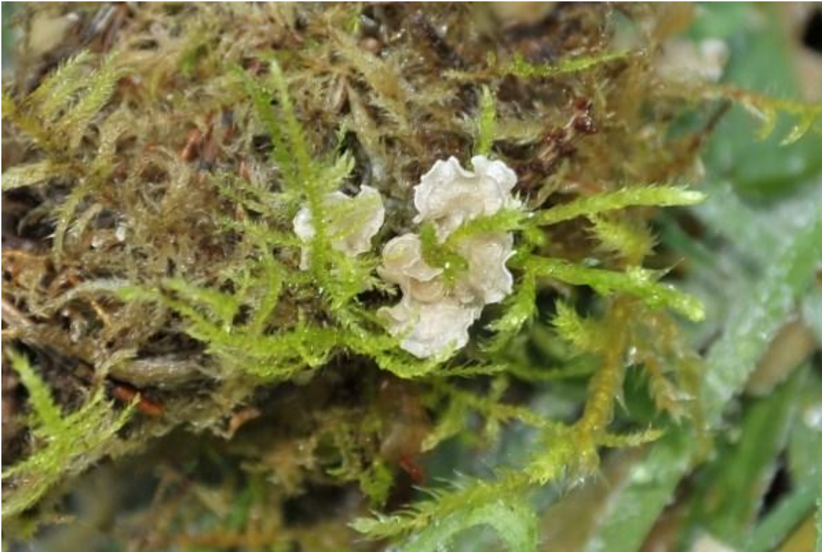
Tussen het mos verscholen het gerimpeld mosoortje